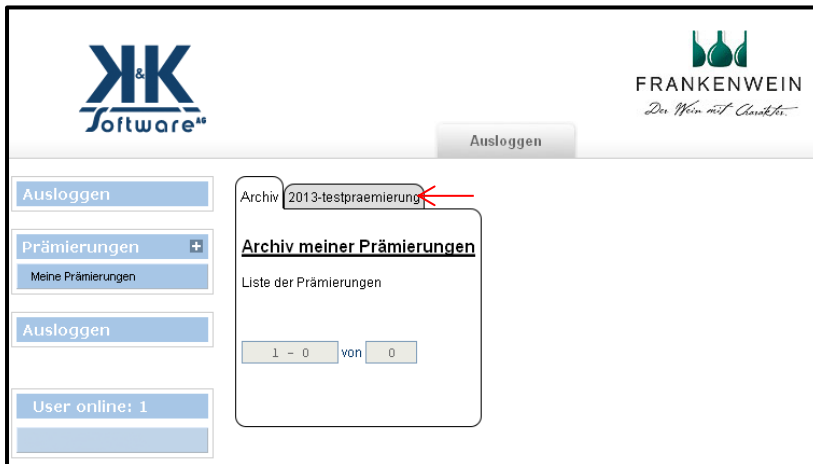
Abbildung 4: Archiv meiner Prämierungen

Hier werden Sie in Zukunft alle online erfassten Weine/Sekte sehen (Abb. 4)