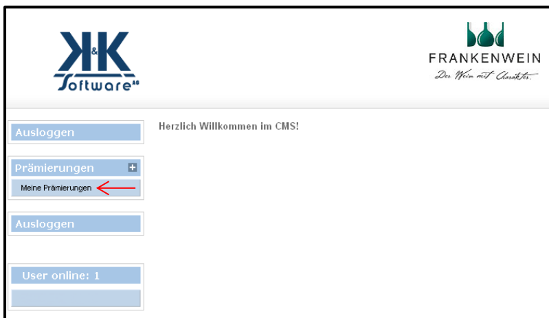
Abbildung 3: Meine Prämierungen