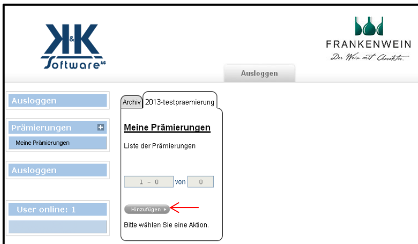
Abbildung 5: Aktuelle Weinprämierung

Sie können stets die aktuelle Weinprämierung auswählen, auch Anmeldungen zu „Best of Gold“ etc. werden hier angeboten werden (Abb. 5: Auswahl „2013-testpraemierung“)